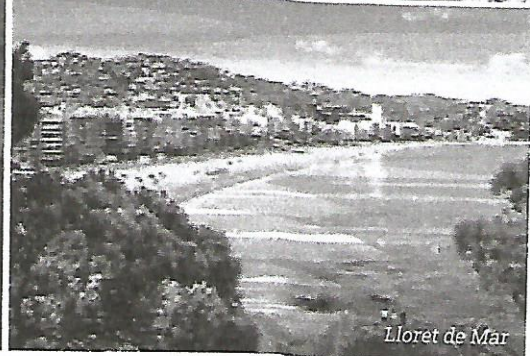
Lloret de Mar